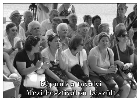
Képtünk a tavalyi Mezi Fesztiválon készült

A programok július 13-án, pénteken kezdődnek, akkor délben teremfoci baj-